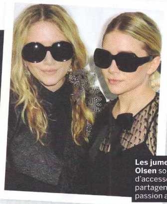
Les jumelles Olsen sont dingues d'accessoires et partagent leur passion avec nous.